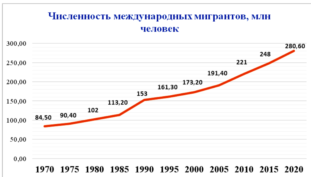
Рис. 1. Динамика глобального миграционного потока