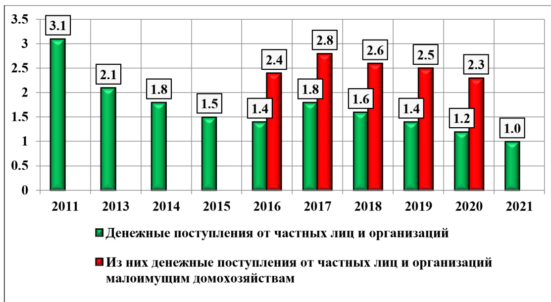
Рис. 2. Доля поступлений от частных лиц и организаций в структуре доходов домохозяйств в Российской Федерации, %

ВНДН и его выходные таблицы постоянно совершенствуются. Так, начиная с 2016 г. данные по отмеченным позициям приводятся не только по всем категориям домохозяйств, вошедших в выборку, но и отдельно по малоимущим домохозяйствам. Имевшиеся к моменту написания статьи данные свидетельствуют, что при сравнительно небольшой доле благотворительных поступлений в суммарных денежных доходах домохозяйств в целом, последние действительно направляются прежде всего в малоимущие домохозяйства [Выборочное наблюдение доходов населения ... , 2022]. Доля таких поступлений в бюджетах последних в период 2016–2020 гг. превышала эту же долю во всех домохозяйствах в 1,56–1,92 раза (рис. 2).